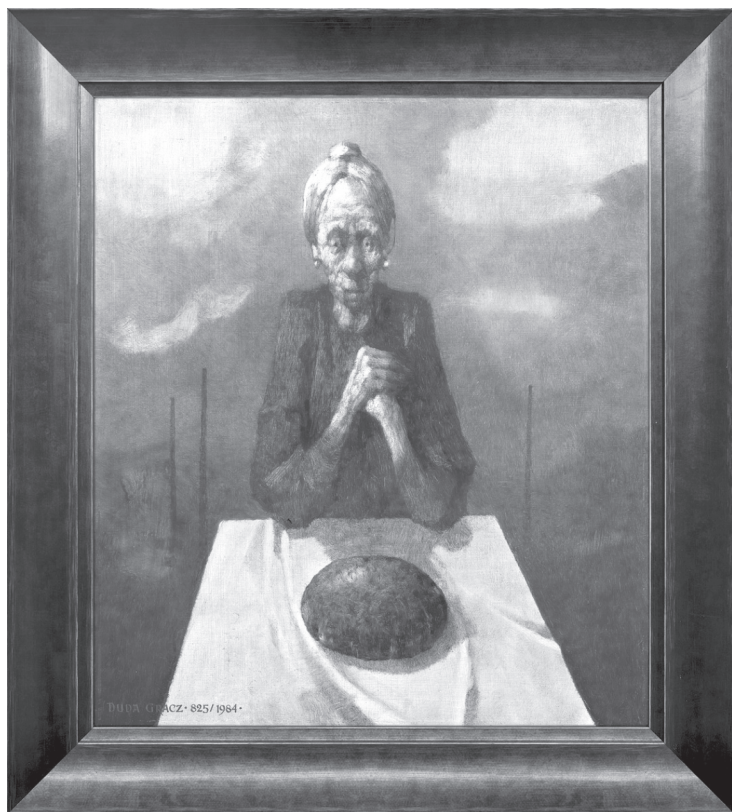
MOTYW POLSKI (CHLEB), 1984 Jerzy Duda Gracz

przybyszów chlebem i solą. Obecnie zwyczaj ten praktykowany jest na weselach, gdzie nowożeńcy witani są chlebem i solą przez swoich rodziców, co ma zapewnić młodej parze dobrobyt i szczęście. Wigilijny zwyczaj dzielenia się opłatkiem pochodzi od zwyczaju dzielenia się chlebem przez pierwszych chrześcijan. Opłatek stanowi symbol pojednania, życzliwości i wzajemnego przebaczenia. Do dziś to właśnie chleb jest tym, za czym tęsknią Polacy na emigracji.