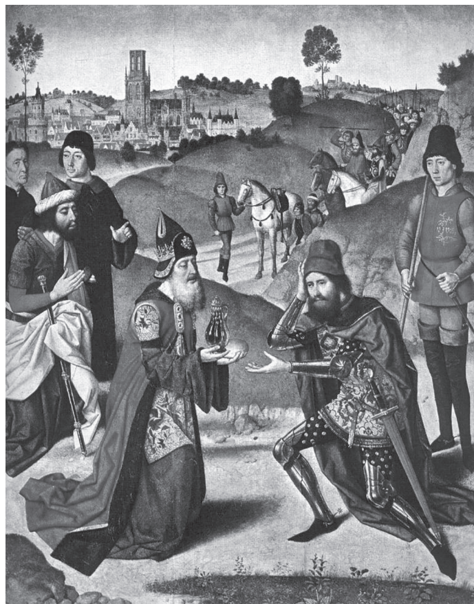
Spotkanie Abrahama z Melchizedekiem Dirk Bouts

W Starym i Nowym Testamencie znajdujemy liczne wzmianki o jego kultowej i kulturowej roli. Jest najbardziej pożądanym darem, o który wierni proszą słowami modlitwy Chleba naszego powszedniego daj nam dzisiaj . Chlebem i winem błogosławił Abrahamowi Melchizedech, król Salemu. Dla całego chrześcijańskiego świata chleb od wieków jest mistycznym symbolem ciała Chrystusa ( Ja jestem chlebem żywym, który zstąpił z nieba. Jeśli kto spożywa ten chleb, będzie żył na wieki. Chlebem, który Ja dam, jest moje ciało za życie świata ). Podczas ostatniej wieczerzy spożywano chleb i wino (ciało i krew Chrystusa), a na jej wspomnienie podczas uczt pierwszych chrześcijan łamano się chlebem. Samo miejsce urodzenia Chrystusa to Betlejem, którego nazwa oznacza Dom chleba. Równie wielkie znaczenie miał chleb w tradycji żydowskiej, zwłaszcza maca - niekwaszony chleb, który lud Izraela zabrał ze sobą uciekając z niewoli egipskiej w pośpiechu, w związku z czym ciasto nie zdążyło wyrosnąć. Później na pustyni lud ten żywił się przez czterdzieści lat chlebem, który Bóg podawał im prosto z nieba.