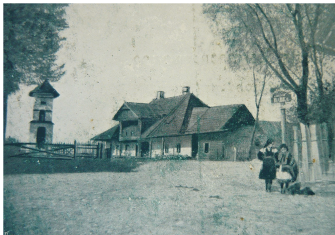
Fot. Karczma przydrożna w Rabce

Karczmy żydowskie były rodzajem zabudowań stanowiących jednocześnie stajnię, wozownię, jak i kwaterę dla ludzi. Najczęściej złożone były z dwóch izb: jednej przeznaczonej dla rodziny gospodarza, drugiej dla przyjezdnych. W czasie szabatu gości nie przyjmowano.