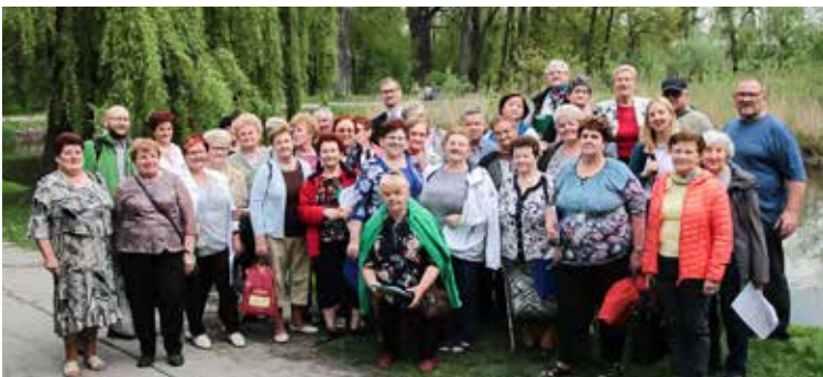
Seniorzy z południa Małopolski (Łącko, Tokarnia, Zawoja, Jordanów) poznawali doświadczenia swoich kolegów z Miechowa i Zabierzowa. Projekt Przestrzeń dla seniorów.

W ramach współpracy z Mapą Pasji powstała też pierwsza Wyprawa Odkrywców tzw. Quest pt. Tokarnia dawniej i dziś. Uruchomiony został również kolejny program Przestrzeń dla seniorów.