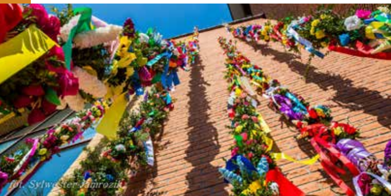
Palmy konkursowe podczas obchodów 50-lecia Niedzieli Palmowej z figurą Jezusa na osiołku