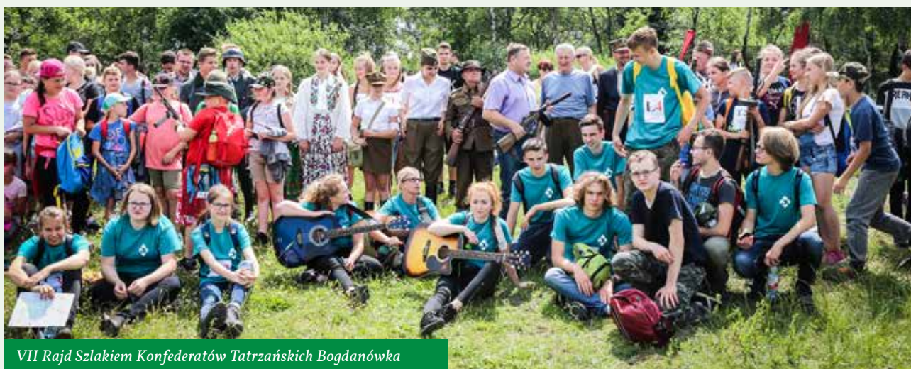
VII Rajd Szlakiem Konfederatów Tatrzańskich Bogdanówka