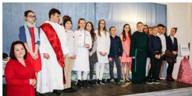
Misterium Wielkopostne w Skomielnej Czarnej