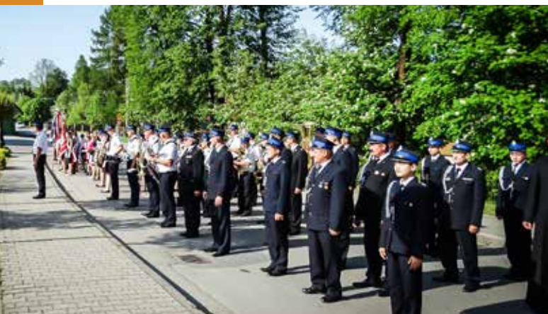
Obchody święta Uchwalenia Konstytucji 3 maja w Tokarni

ści i uśmiech w sercach zawsze gości, niechaj problemy Was omijają i wszyscy Was kochają, bo jak nikt na świecie na to zasługuje. Życzymy abyście szły przez życie zawsze uśmiechnięte i zawsze razem!