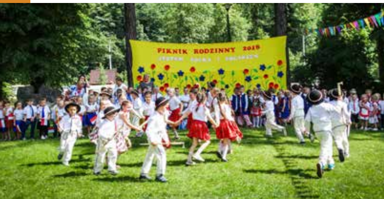
Piknik Rodzinny w Przedszkolu w Tokarni