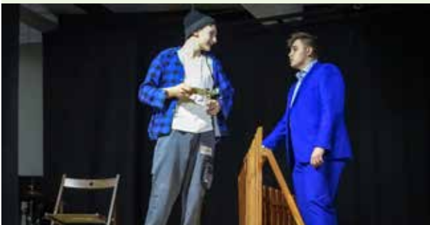
Spektakl Sąsiedzi w wykonaniu Grupy Teatralnej Soli Deo