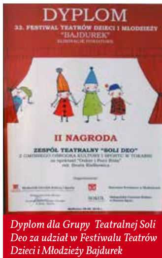
Dyplom dla Grupy Teatralnej Soli Deo za udział w Festiwalu Teatrów Dzieci i Młodzieży Bajdurek