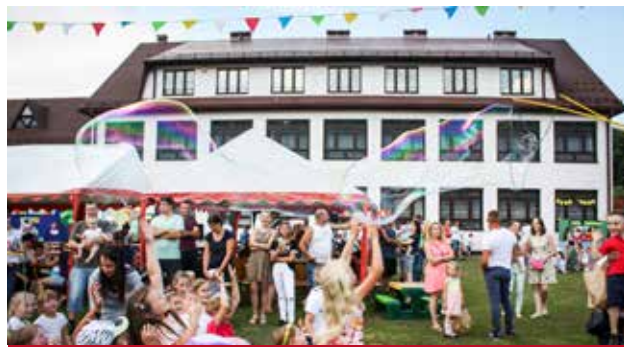
Piknik Rodzinny w Krzczonowie

- Spotkanie ze strażakami i prezentacja wozu strażackiego