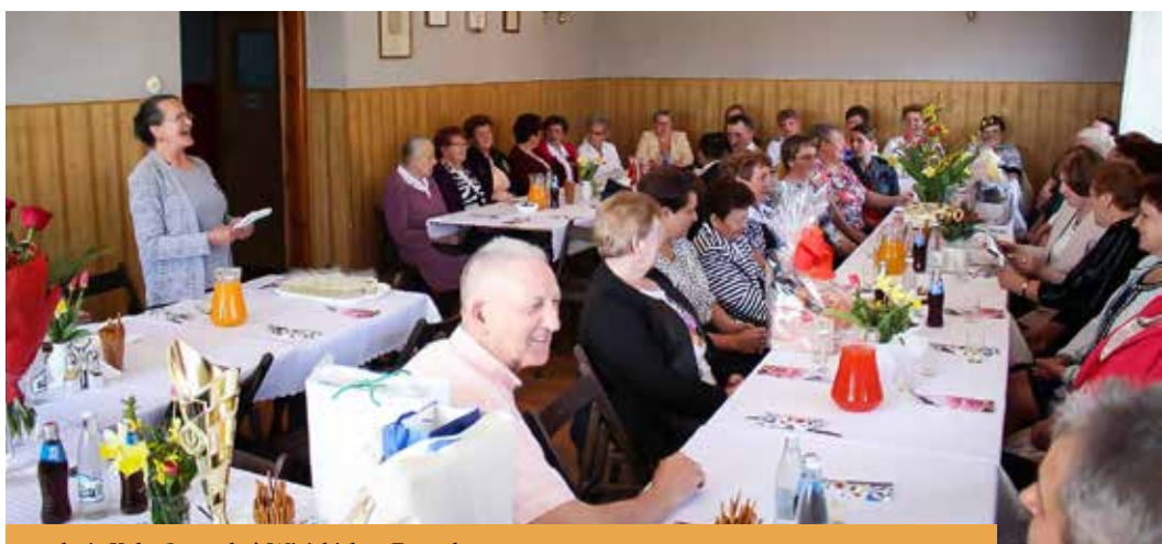
50-lecie Koła Gospodyń Wiejskich w Zawadce

14 kwietnia swój Złoty Jubileusz 50-lecia obchodziło Koło Gospodyń Wiejskich z Zawadki 1968-2018. Z okazji Waszego święta przyjmijcie życzenia wszystkiego najlepszego, niech każdy dzień dostarcza rado-