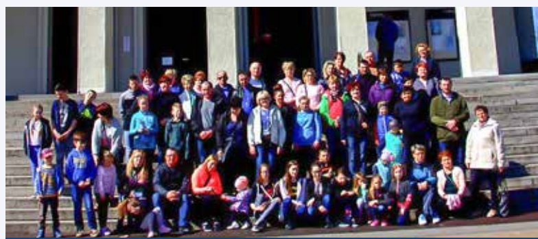
Nieprzemakalni w Niepokalanowie

Kolejną wyprawą była wycieczka w Pieniny. Po drodze była wizyta w Dębnie Podhalańskim, w Jaworkach i spacer Wąwozem Homole, a następnie zdobycie najwyższego szczytu Pienin – Wysokiej (1050 m.n.p.m.) i zejście do Szczawnicy.