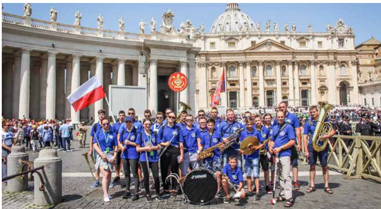
Orkiestra Dęta OSP Tokarnia na Placu Św. Piotra

honorowe miejsce na froncie bazyliki, gdzie na powitanie papieża zagrała m.in. Barkę . Te momenty pozostaną na długo w pamięci. Po audiencji udaliśmy się na intensywne zwiedzanie miasta. Przeszliśmy przez most obok Zamku Świętego Anioła zwiedzając najciekawsze punkty starego Rzymu. Piazza Navona, Panteon, Fontanna di Trevi, Kapitol, Forum Ro-