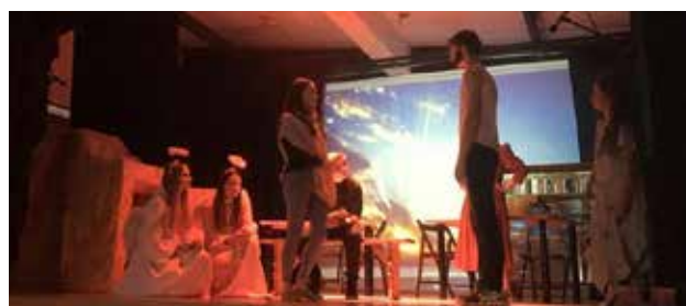
Misterium Wielkanocne w wykonaniu Grupy Teatralnej Soli Deo, scena GOKiS, 8 kwietnia Tokarnia