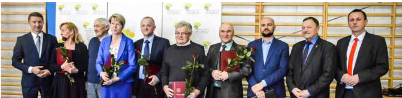
Powiatowy Dzień Sołtysa