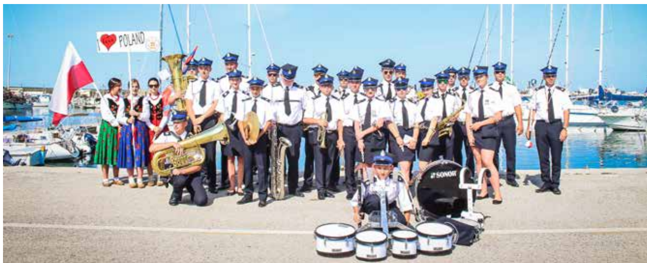
Przed Defiladą przy Molo Nord w Giulianowa