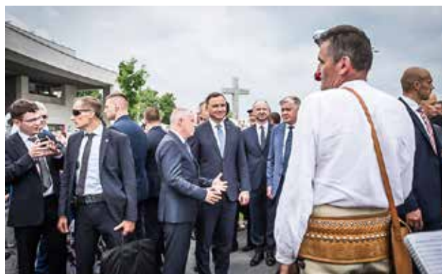
Święto Dziękczynienia, wraz z prezydentem RP Andrzejem Dudą