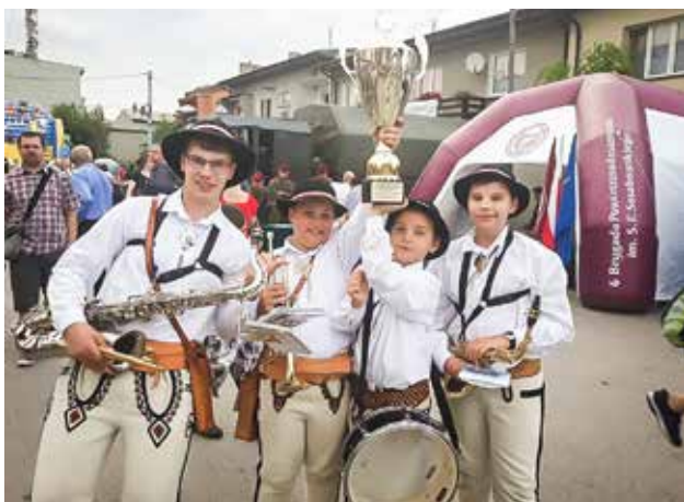
Międzynarodowym Festiwalu Orkiestr Wojskowych i Dętych w Skale

W Święto Uchwalenia Konstytucji 3 maja orkiestra zagrała na uroczystej mszy św. w intencji Ojczyzny w kościele parafialnym w Skomielnej Czarnej o godzinie 11.00. Po mszy odbył się koncert pieśni i marszy patriotycznych. Dnia 19 maja 2018 muzycznie uświetniliśmy uroczystość jubileuszową Małopolskiej Izby Rzemiosła, która rozpoczęła się od mszy św. w Bazylice Mariackiej o godz. 10.00, a następnie odbył się podniosły przemarsz rynkiem krakowskim, któremu przewodniczyliśmy. Zakończenie miało miejsce na Rynku Głównym pod Międzynarodowym Centrum Kultury.