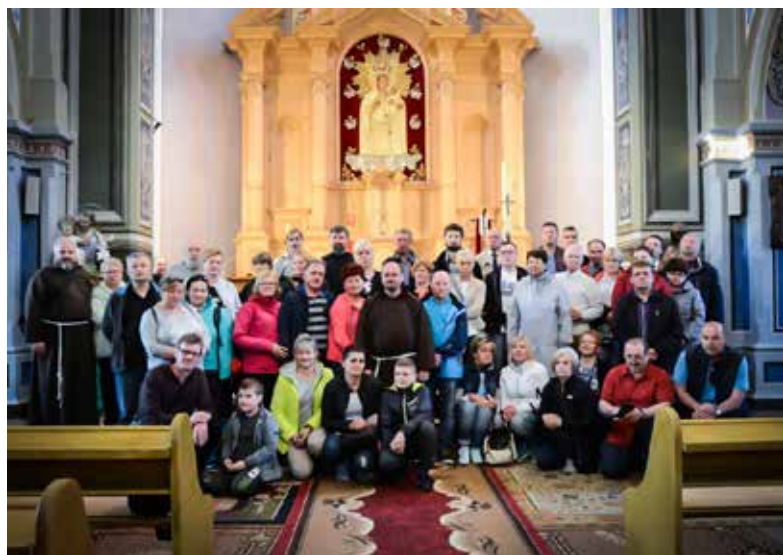
Pielgrzymi w Kołomyi

Kolejny dzień pielgrzymki upłynął nam pod znakiem zwiedzania zamków obronnych Chocimia i Kamieńca Podolskiego, będących wizytówką tych miast. Pierwszy z nich malowniczo położony nad brzegiem rzeki Dniestr jest zaliczany do „siedmiu cudów Ukrainy” i z całym przekonaniem możemy powiedzieć, że wart jest tego miana. W 1621 r. zamek ten był świadkiem wspaniałego zwycięstwa hetmana Jana Chodkiewicza wspieranego przez kozaków nad siłami Imperium Osmańskiego pod dowództwem