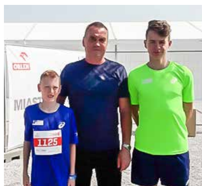
Warszawa - Orlen Warsaw Marathon