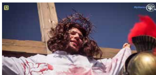
Jubileuszowa XX Droga Krzyżowa

Jubileuszowa XX Droga Krzyżowa wyruszyła w Wielki Piątek z Kaplicy św. Jana Chrzciciela z Bogdanówki. Pod hasłem „Po tym poznaliśmy miłość, że On oddał za nas życie swoje”, młodzież Parafii Nawiedzenia NMP w Skomielnej Czarnej szła na Koskową Górę i w przejmujący sposób przedstawiała Sceniczną Drogę Krzyżową. Wraz z młodzieżą szli ludzie, którzy przeżywali kolejne stacje tejże drogi.