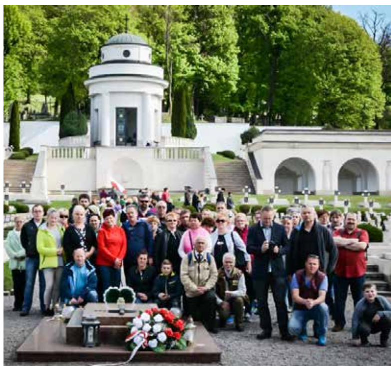
Pielgrzymi na Cmentarzu Orłąt Lwowskich

Już na samym początku cały przebieg pielgrzymki i wszystkie sprawy z którymi się wybraliśmy, zawierzyliśmy opiece Matki Bożej