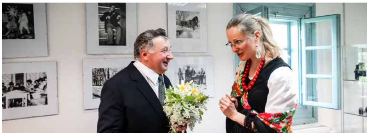
Otwarcie wystawy w Muzeum Orawski Park Etnograficzny w Zubrzycy Górnej, 29 kwietnia 2018 r.