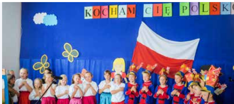
Gminny Konkurs Pieśni i Piosenki Patriotycznej „Kocham cię Polsko” – Przedszkole w Krzczonowie

Słuchając prezentowanych pieśni na myśl przychodziły często bardzo trudne i dramatyczne momenty polskiej historii. I czasem trudno było uwierzyć, że dzieci przedszkolne