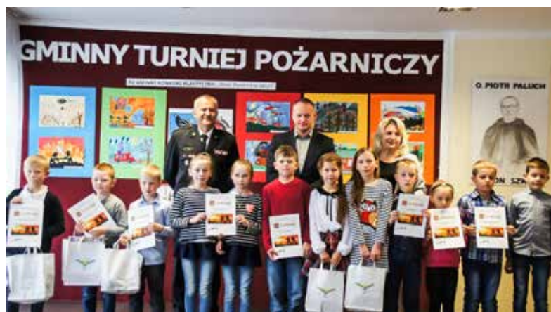
XV Gminny Turniej Pożarniczy w SP Skomielnej Czarnej, 17 maja