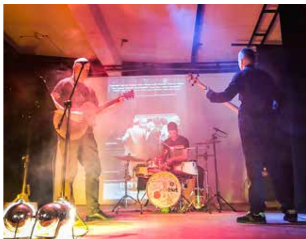
Fragment koncertu Modlitwa Serca Silniejsza od Słów, 25 maja 2018