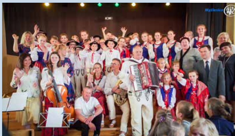
Mali Krzczonowianie z wizytą na Kresach

W maju b.r. Zespół Regionalny Mali Krzczonowianie na zaproszenie polskiej szkoły im. Szymona Konarskiego w Wilnie odbył kilkudniową wycieczkę na Litwę. Mali Krzczonowianie od razu zdobyli sympatię wszystkich. Pomimo że tamtejsze dzieci i młodzież uczą się polskiego folkloru to jednak góralski repertuar wywierał na nich ogromne wrażenie. Zespół odwiedził m.in. Grodno i Wilno. Telewizja iTV Myślenice, która była patronem medialnym wyjazdu przygotowuje obszerny dokument filmowy, który będzie niebawem dostępny na stronach internetowych.