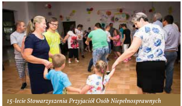
15-lecie Stowarzyszenia Przyjaciół Osób Niepełnosprawnych