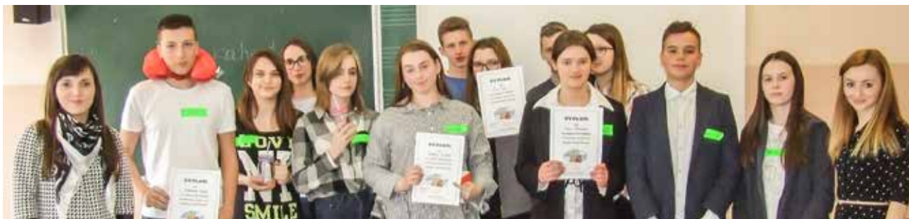
Współpraca zamiast rywalizacji – konkurs języka angielskiego