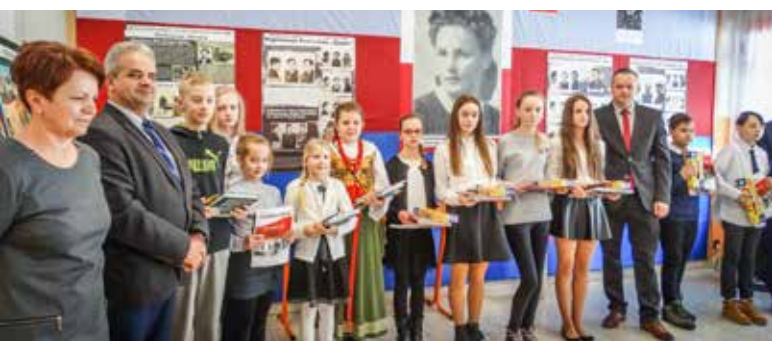
Dzień Żołnierzy Wyklętych w Bogdanówce