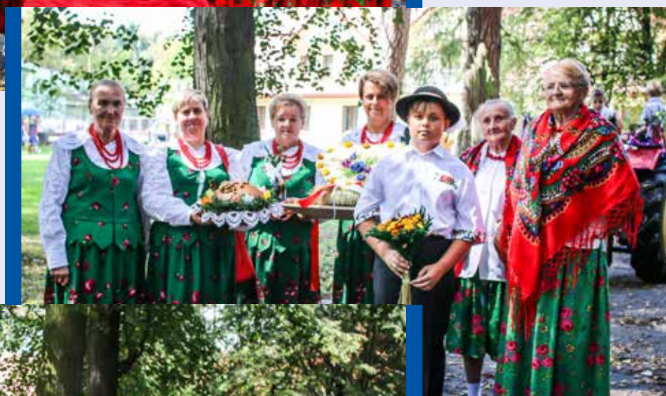
Koło Gospodyń Wiejskich ▶ z Skomielnej Czarnej