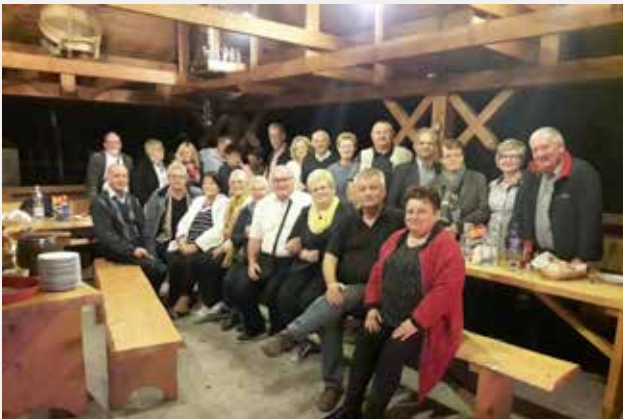
Pożegnalna kolacja i spotkanie z gośćmi z Francji w Zajeździe pod Solniskiem