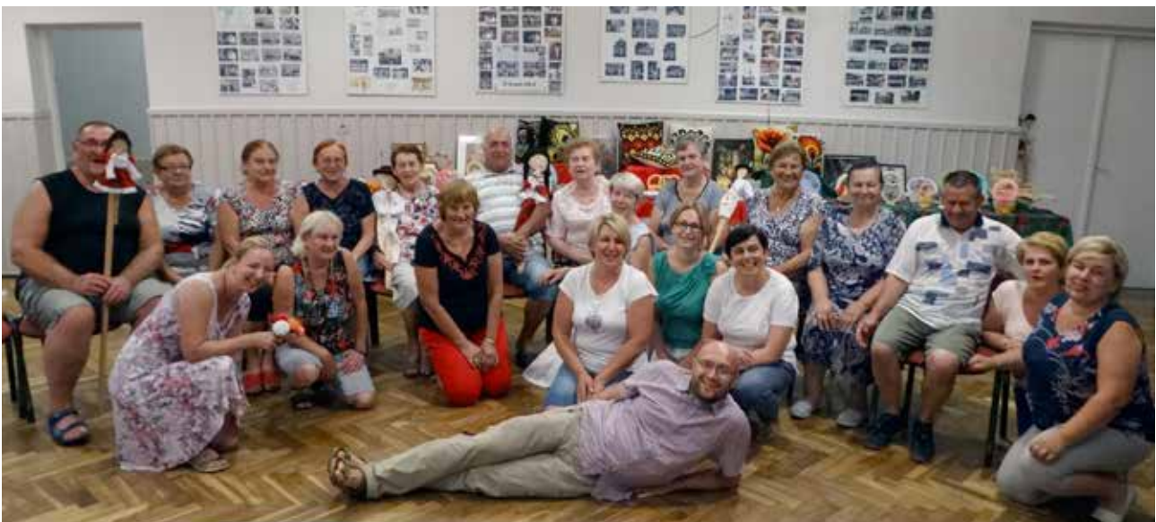
Seniorzy z gminy Łącko i Zabierzów u seniorów z gminy Tokarnia