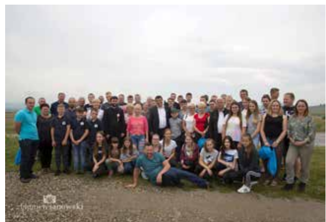
Pobyt w Baile Figa