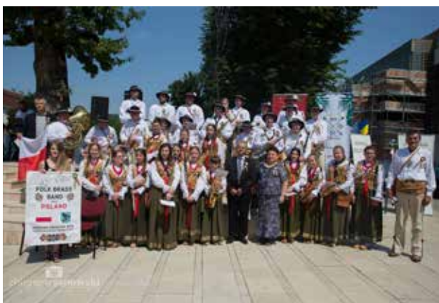
Dni Miasta Beclean delegacja z Polski