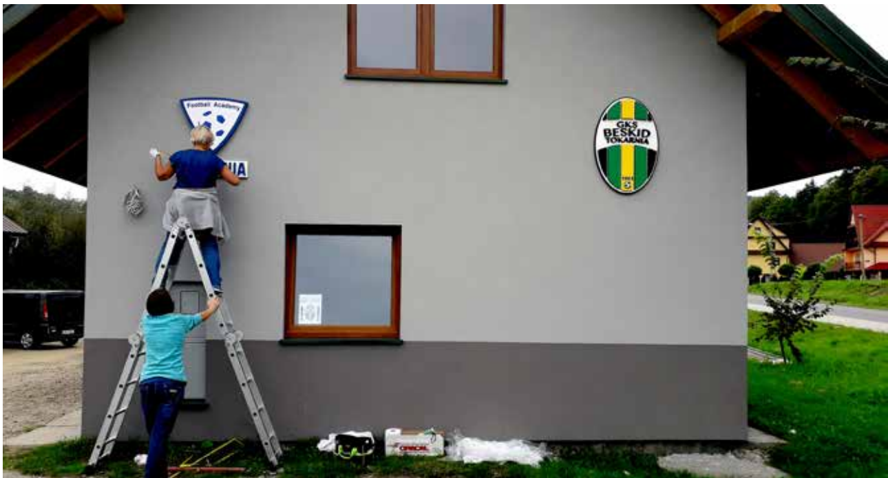
Szatnia Gminnego Klubu Sportowego Beskid Tokarnia po remoncie elewacji.