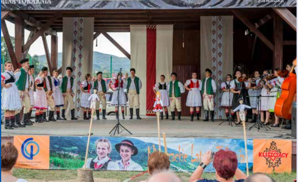
Zespół Regionalny ▶ BYSTRY POTOK z Kacwina