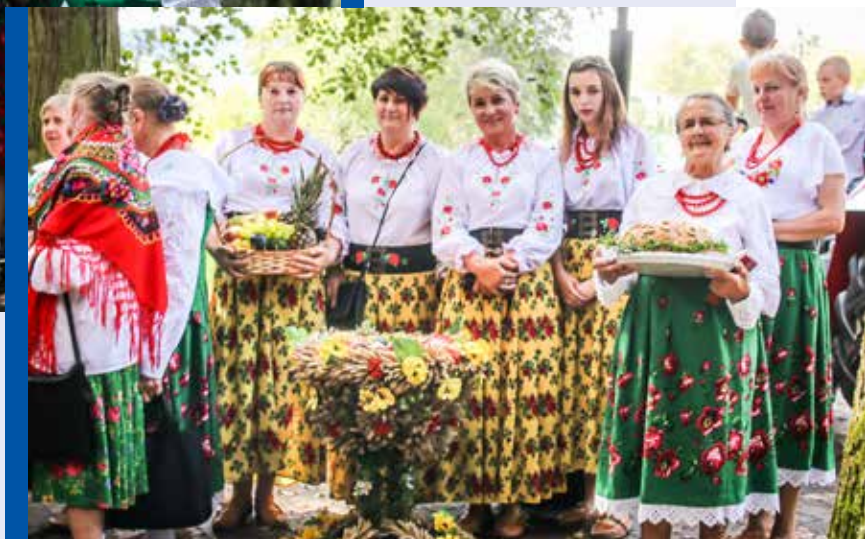
Koło Gospodyń Wiejskich ▶ z Zawadki