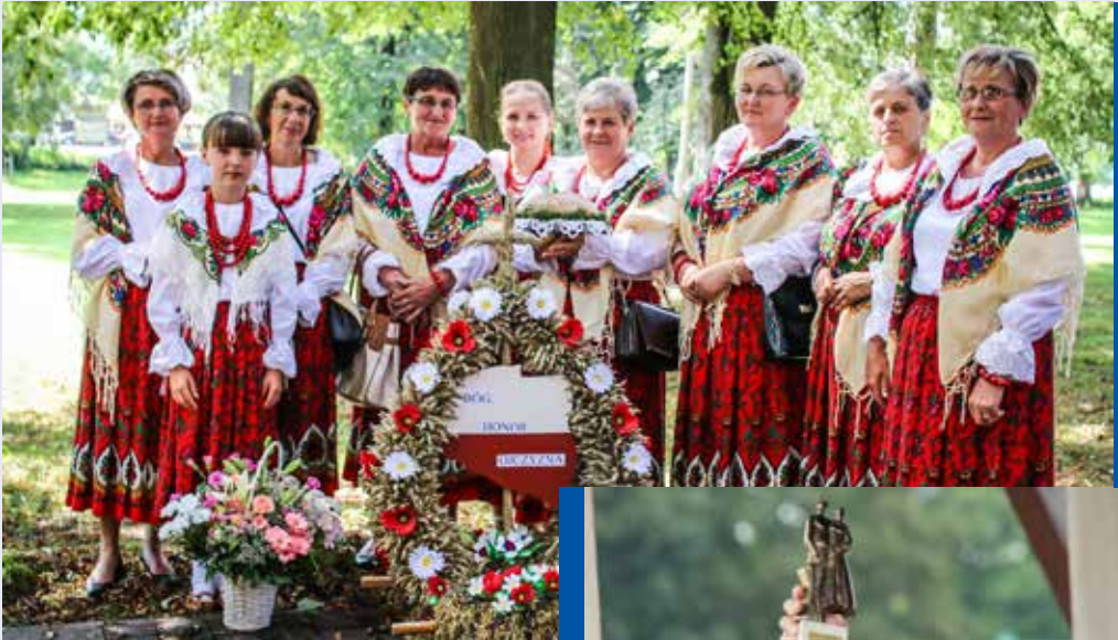
◀ Koło Gospodyń Wiejskich z Bogdanówki