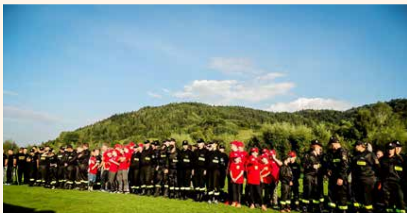
XIII Międzynarodowe Zawody Sportowo-Pożarnicze