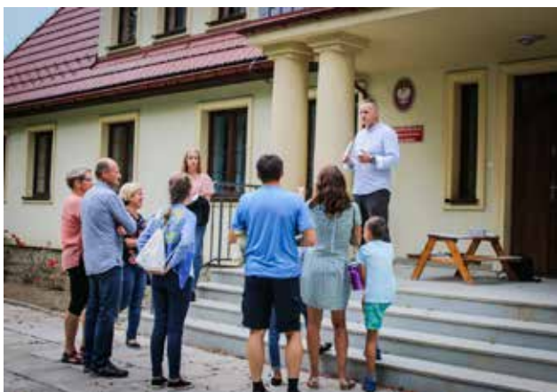
Inauguracji pierwszej mobilnej aplikacji w Tokarni