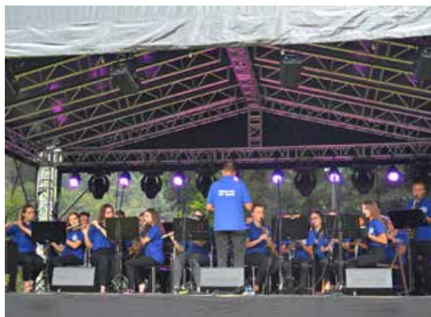
Orkiestra Dęta OSP z Tokarni

W międzyczasie przy kościele na dzień wcześniej rozłożonej plenerowej scenie obsługa przygotowywała nagłośnienie na popołudniowy festyn. Po mszy św. nastąpiła uroczysta procesja, prowadzona przez ministrantów, poczty sztandarowe: Ochotniczej Straży Pożarnej, Szkoły Podstawowej i Gimnazjum, Arcybactwa Straży Honorowej Najświętszego Serca Pana Jezusa oraz członkinie Koła Gospodyń Wiejskich z Więcierzy niosące różaniec. Następnie mieszkańcy