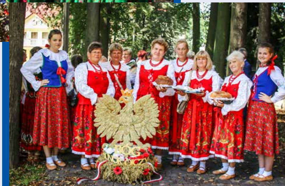
Koło Gospodyń Wiejskich ▶ z Krzczonowa