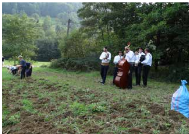
Koło Gospodyń Wiejskich z Bogdanówki podczas Tuki