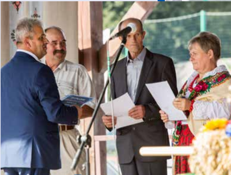
◀ Wójt gminy nagradza rolników za produkcję rolną