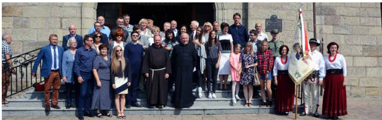
Pielgrzymi z Kołomyji