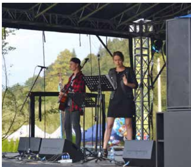
Lost InDeSity zespół z Klikuszej