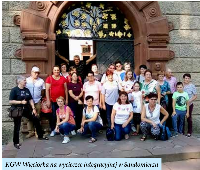
KGW Więciórka na wycieczce integracyjnej w Sandomierzu