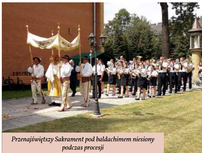
Przenajświętszy Sakrament pod baldachimem niesiony podczas procesji

na chwilę wstąpił do dworu i swoją obecnością i przyjazdem wniósł choć na chwilę radość w przygnębione przejściami wojennymi serca ludu i dworu.