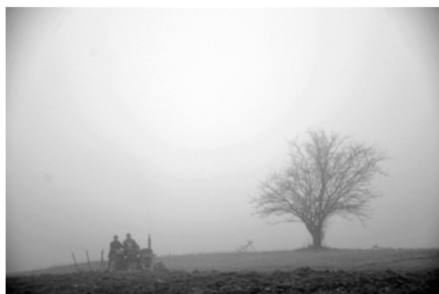
Marek Metelica (Tenczyn) - Mleczna Droga - III miejsce