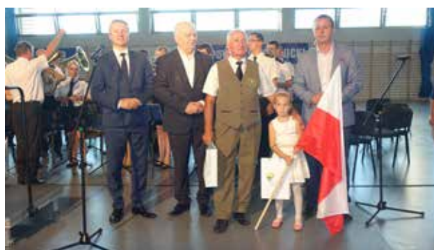
Powiatowy Przegląd Orkiestr Dętych „Dla Niepodległej”