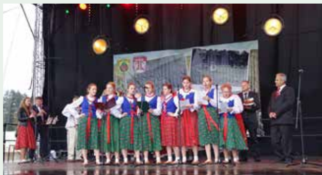
Koło Gospodyń Wiejskich z Krzczonowa – Dożynki Powiatowe w Raciechowicach

Deszczowa pogoda nie przeszkodziła mieszkańcom powiatu, a przede wszystkim rolnikom w podziękowaniu za tegoroczne plony. Główne uroczystości odbyły się na kompleksie sportowym LKS Grodzisko