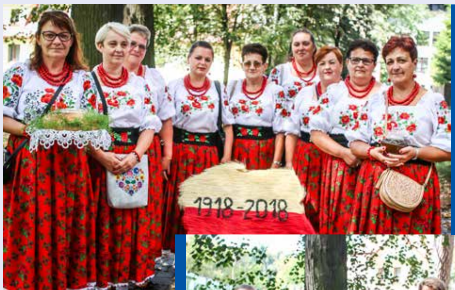
◀ Koło Gospodyń Wiejskich z Więciórki