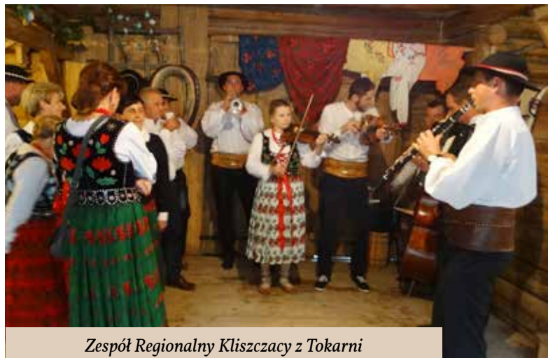
Zespół Regionalny Kliszczacy z Tokarni