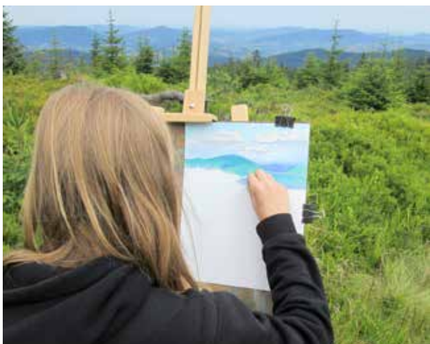
Plener na Turbaczu zorganizowany przez Pracownię Na Piętrze