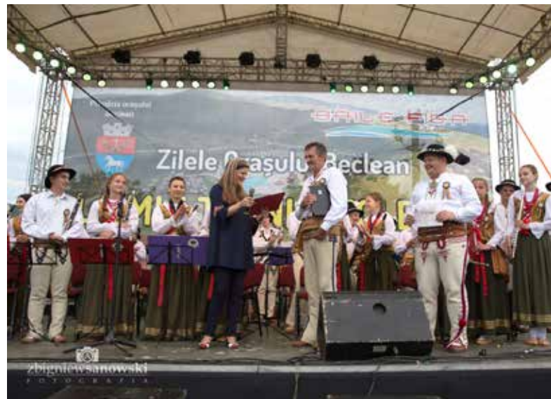
Występ podczas dni miasta Beclean

Tego dnia Orkiestra Dęta ze Skomielnej Czarnej i Bogdanówki miała okazję zaprezentować się po raz kolejny. Wieczorem na scenie w centrum miasta poka-