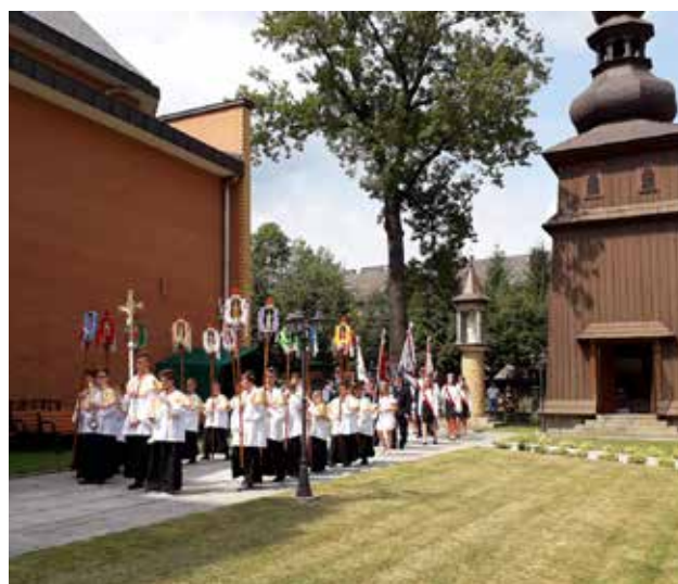
Procesja odpustowa 2018

Po sumie procesja piękna choć skromna stanowi dla ludu najwyższy wyraz uczuć religijnych ku czci M. Bożej, kiedy to kapłan celebrujący poprzedzony przez Krzyż, obrazy, liczny zastęp dziewczątek rzucających kwiaty, w otoczeniu duchowieństwa, chorągwi, ludu ze światłem, prowadzony przez dziedzica Tokarni, niesie Przenajświętszy Sakrament pod baldachimem i przechodzi powoli w uroczystym obchodzie dookoła kaplicy przy odgłosie dzwonków i śpiewu pieśni ku czci Bogarodzicy, aby po zaintonowaniu „Te Deum” wrócić do ołtarza i zakończyć błogosławieństwem Najśw. Sakramentu. (...)