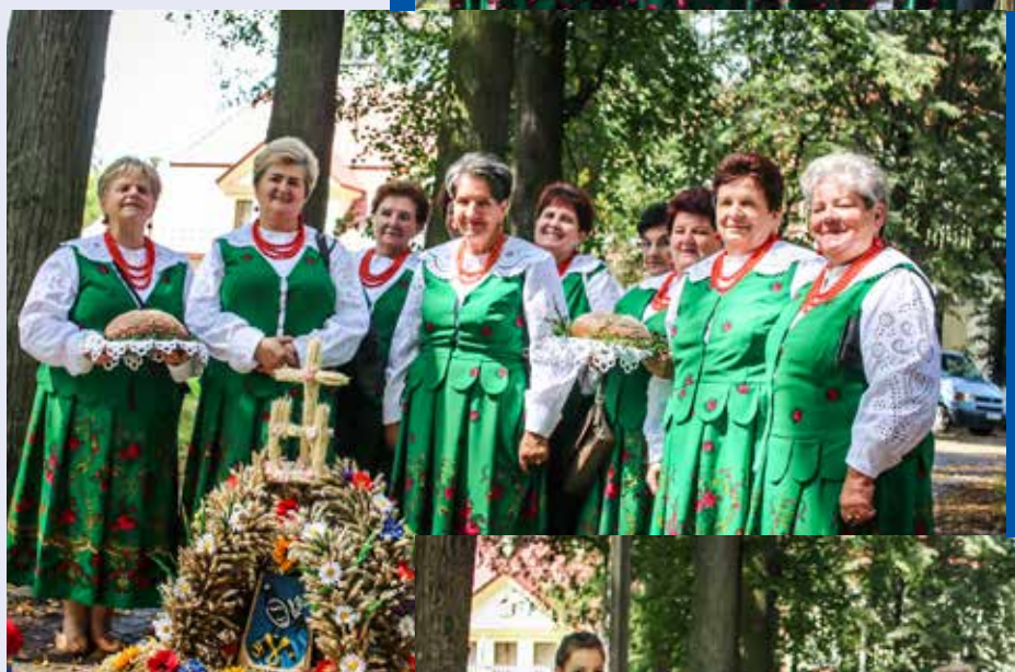
◀ Koło Gospodyń Wiejskich z Tokarni