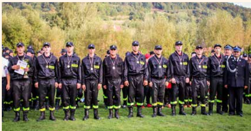
Zwycięzcy zawodów druhowie OSP Krzczonów