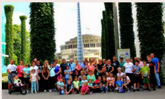
Nieprzemakalni we Wrocławiu

W wycieczce w dniach 8 i 9 września wzięło udział 59 osób, 29 dzieci i 30 osób dorosłych. Zwiedzanie Wrocławia rozpoczęliśmy do Panoramy Raclawickiej, która wywarła bardzo duże wrażenie na wszystkich uczestnikach. Następnym punktem było Muzeum Narodowe we Wrocławiu, które zrobiło na niektórych z nas tak ogromne wrażenie, że stwierdzili, że jedzenie im nie jest konieczne, bo to mają w domu i po prostu zwiedzali, zwiedzali, zwiedzali. Teraz przyszła kolej na Pawilon Czterech Kopuł i wystawę polskiej sztuki współczesnej, Iglicę, Halę Stulecia, pergolę i pokaz fontann. Wieczorem wraz z przewodnikiem udaliśmy się na zwiedzanie Starego Miasta i poszukiwanie wrocławskich krasnali. Drugi dzień rozpoczęliśmy od Mszy św. w Archikatedrze Wrocławskiej na Ostrowie Tumskim. Po śniadaniu udaliśmy się do wrocław-