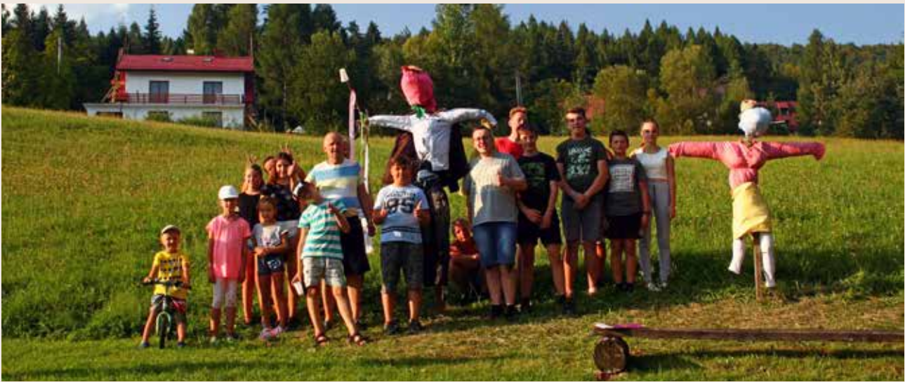
Warsztaty pt. Strachy- nie tylko na wróble

Warsztaty przeprowadzili: Andrzej Słonina i Wojtek Molus.