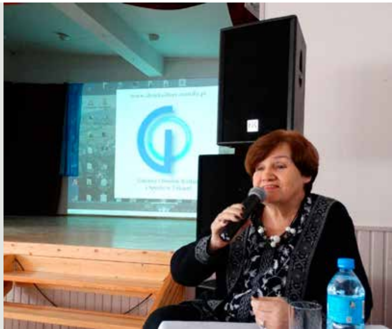
Bogna Wernichowska podczas spotkania z młodzieżą z SP nr 1 oraz Gimnazjum w Tokarni

Podczas spotkania zaprezentowany został film Osobliwości starego Krakowa . Następnie o godz. 18.00 w Dworze Targowskich pisarka spotkała się z mieszkańcami. Bogna Wernichowska, pisarka, dziennikarka i publicystka. Absolwentka UJ (prawo) i UW (studium dziennikarskie). Przez wiele lat była publicystką tygodnika „Przekrój”, zajmując się problematyką obyczajową, kulturalną, pisząc też o swoich podróżach i zainteresowaniach wszystkim co dziwne, niezwykle i tajemnicze. W roku 2006 otrzymała