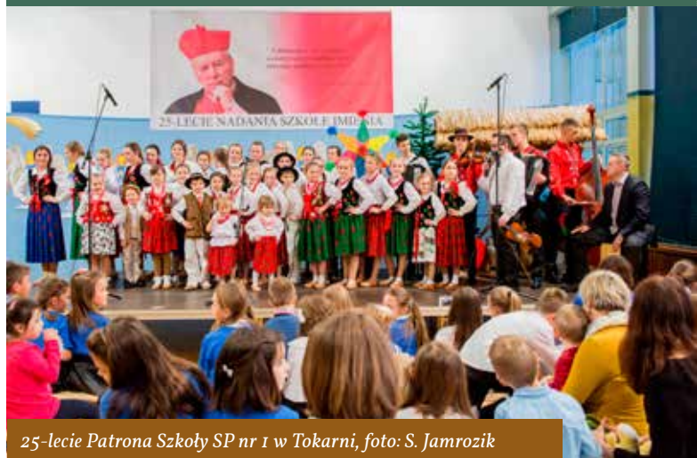
25-lecie Patrona Szkoły SP nr 1 w Tokarni

Pisząc o życiu szkoły nie sposób nie wspomnieć o niewątpliwie największym wydarzeniu, jakim było ŚWIĘTO PATRONA SZKOŁY DNIEM RODZINNEGO KOŁĘDOWANIA w dniu 15 stycznia 2017r. W tym roku połączone z 25 rocznicą nadania imienia naszej szkole, co jeszcze bardziej podkreśliło podniosły charakter tej uroczystości. To był dzień wspólnego świętowania ze społecznością