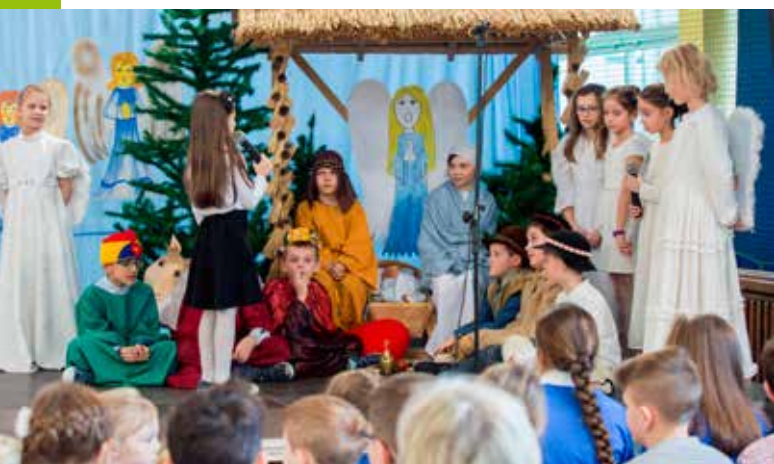
25-lecie Patrona Szkoły SP nr 1 w Tokarni, foto: S. Jamrozik