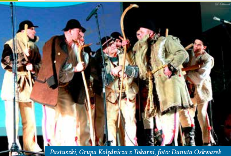
Pastuszki, Grupa Kołędnicza z Tokarni