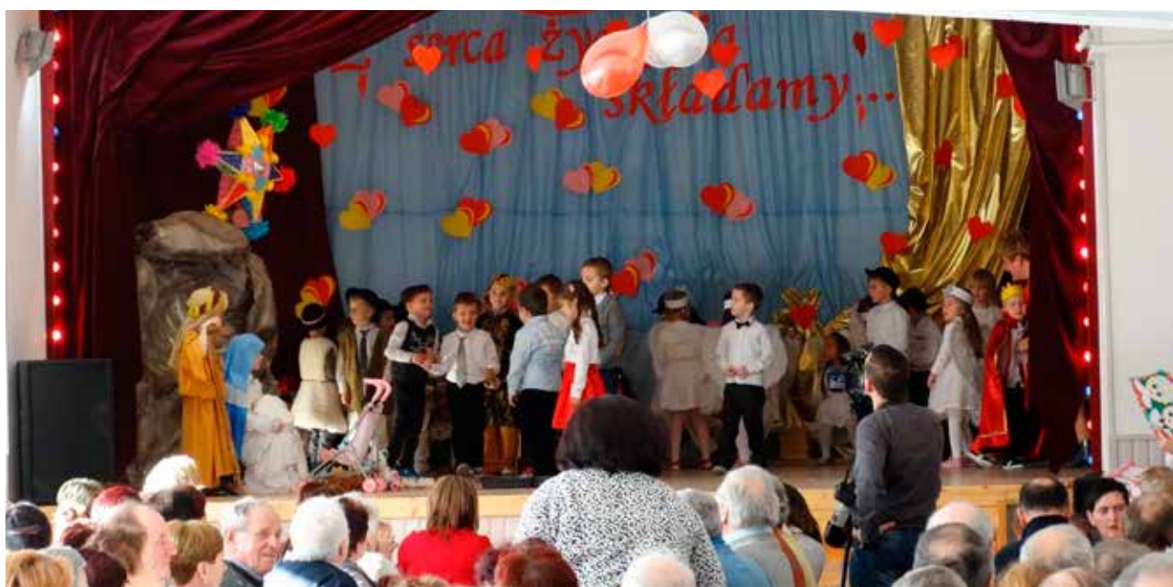
Dzień Babci i Dziadka, foto: B. Dyrz