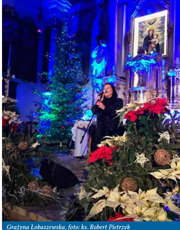
Grażyna Łobaszewska

Podczas koncertu nie zabrakło przepięknych kolęd takich jak: Jezus Malusieńki , Cicha noc , Przybieżeli do Betlejem , czy Bóg się rodzi . Styczniowy recital był niepowtarzalną okazją do osobistego spotkania z piosenkarką, która od ponad 40 lat wywiera niebagatelny wpływ na kształt polskiej sceny muzycznej. Grażyna Łobaszewska, to jedna z najwybitniejszych polskich piosenkarek, kompozytorek i autorek wielu śpiewanych przez siebie utworów. „Najczarniejsza z białych kobiet”, bez wahania porównywana z Arethą Franklin czy Billie Holiday.