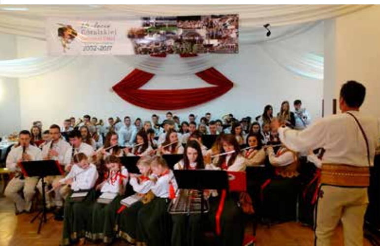
Góralська Orkiestra Dęta ze Skomielnej Czarnej i Bogdanówki, członkowie, założyciele, przyjaciele i sponsorzy, 2017