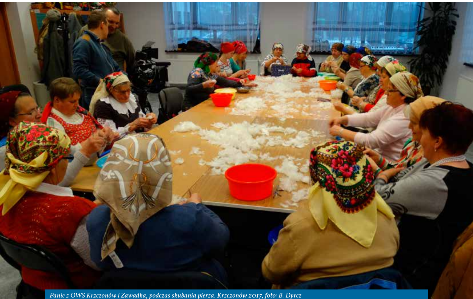
Panie z OWS Krzczonów i Zawadka, podczas skubania pierza. Krzczonów 2017